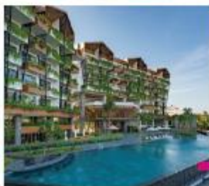
Bellerive Hoi An Hotel and Spa